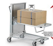
Chariot à fond constant