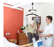
Rail de transfert